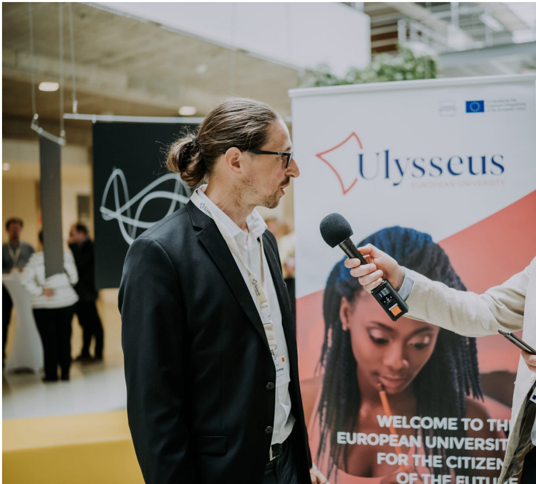
Ilustración 4: Entrevistas realizadas durante el Summit de Kosice

En este sentido, la presencia en medios de comunicación tradicionales, como prensa, radio y televisión, depende mucho del potencial que estos medios tengan dentro del ámbito universitario en cada país. Así, en Sevilla, gracias al apoyo del departamento de Comunicación de la Universidad de Sevilla, la presencia ha sido recurrente, especialmente cuando se producen hitos como la creación de Ulysseus, el añadido de nuevos socios o los primeros programas conjuntos.