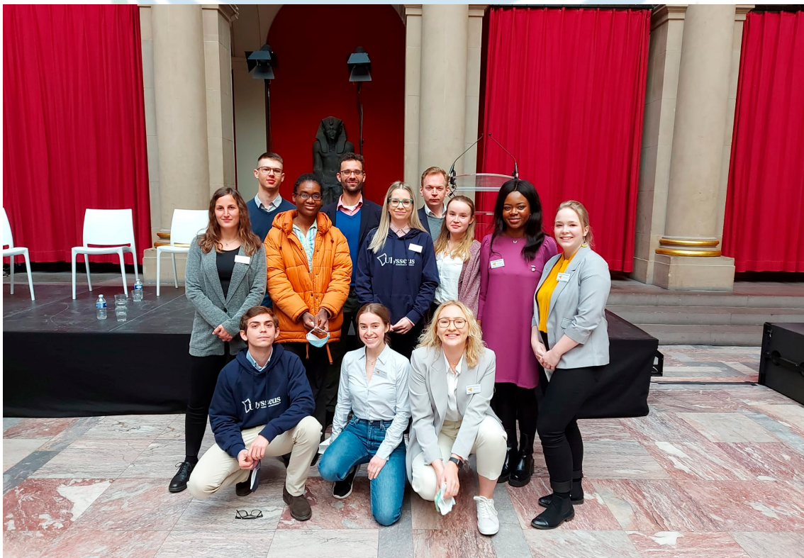
Ilustración 5: Estudiantes de Ulysseus durante la celebración de la Asamblea Europea de Estudiantes

La experiencia de trabajar con Ulysseus no podría entenderse sin estos paquetes de trabajo que son, sin duda, el corazón operativo de la alianza. Su importancia radica en su capacidad para estructurar, coordinar e implementar la visión estratégica de Ulysseus, asegurando que todos los actores involucrados puedan contribuir de manera efectiva y beneficiarse de los resultados obtenidos. La especialización y la integración de los paquetes de trabajo fomentan sinergias que potencian el impacto del proyecto, mientras que su capacidad para vehicular y vertebrar el funcionamiento de Ulysseus garantiza una gestión eficiente y una implementación exitosa de sus objetivos.