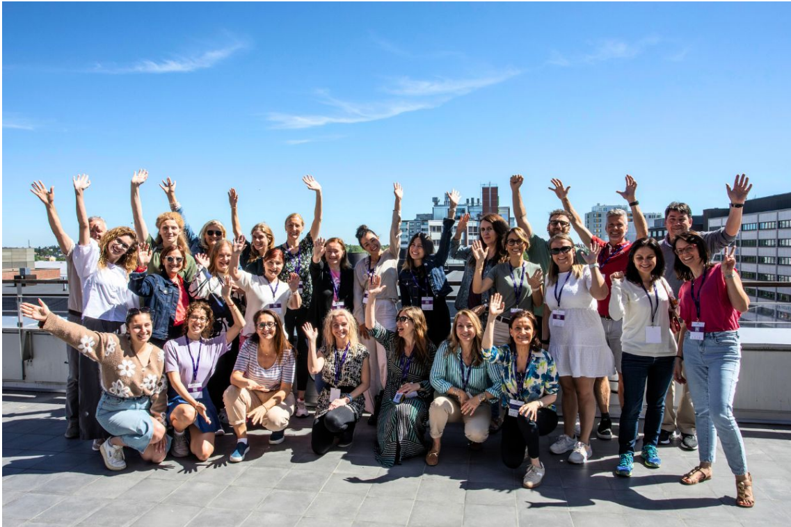
Ilustración 3: Participantes en el BIP sobre competencias interculturales celebrado en la universidad de Haaga Helia en Helsinki

Estos programas, abiertos a la participación tanto de estudiantes y personal académico y no académico, han cubierto una amplia gama de temas y brindan a los participantes conocimientos valiosos y habilidades prácticas. Desde explorar la ética y la gestión energética hasta mejorar las competencias interculturales y la innovación digital, los programas están diseñados para atender diversos intereses y necesidades de desarrollo profesional.