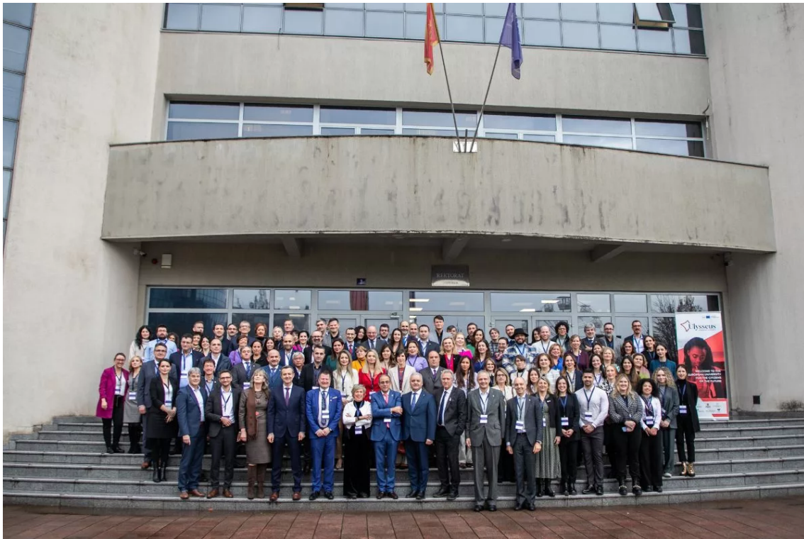
Ilustración 2: El equipo de Ulysseus durante el evento celebrado en Montenegro para celebrar el inicio de la segunda fase

Pero no sólo de Europa se ha alimentado el trabajo conjunto de Ulysseus. En línea con los objetivos europeos de la Comisión, Ulysseus tiene una visión amplia del futuro que incluye a socios estratégicos más allá de las fronteras europeas. Vietnam, en concreto la Universidad de Da-Nang, fue la protagonista de la primera colaboración internacional de Ulysseus, una alianza consolidada en un encuentro en el país asiático que sentó las bases de esos nuevos lazos internacionales con otros continentes como Asia, África o América Latina.