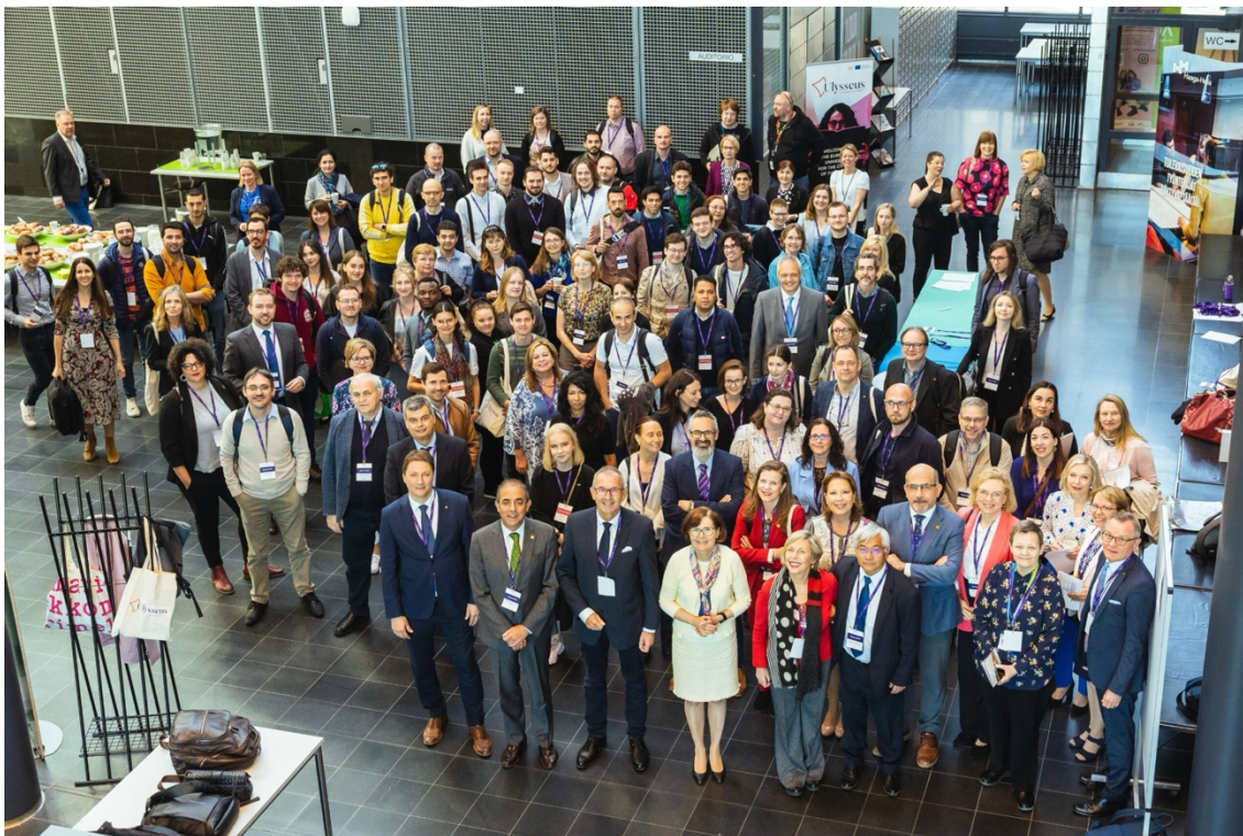
Ilustración 1: Summit en Helsinki

en el marco de Ulyseus, investigadores impulsando conjuntamente futuros proyectos de Horizonte Europa y colaborando en talleres sobre los temas de innovación más actuales, como la inteligencia artificial, la robótica o el tratamiento de datos; y el personal administrativo debatiendo sobre las mejores fórmulas para consolidar la estructura de la alianza.